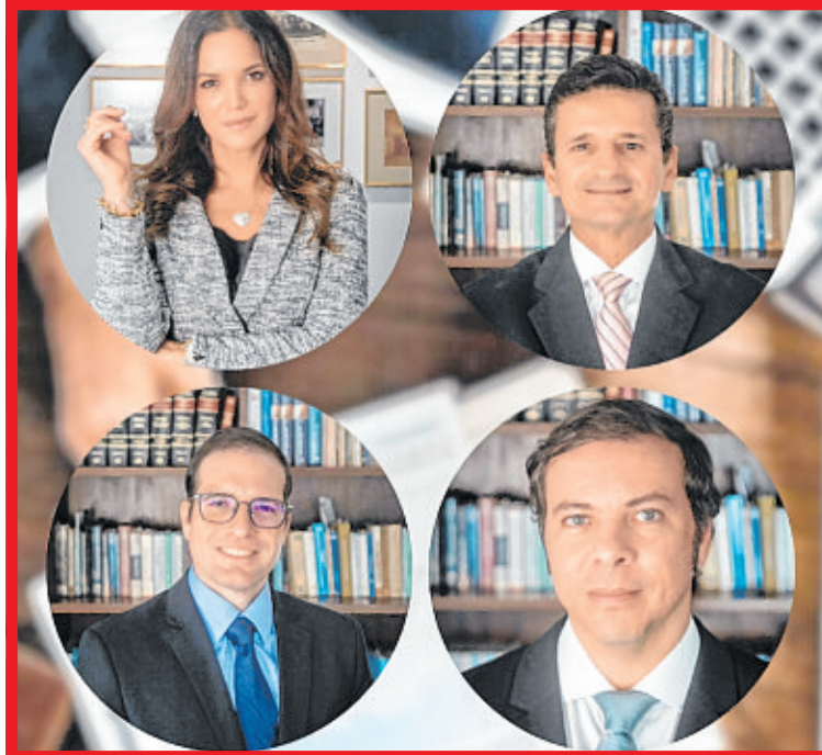
Coordenadores e participantes